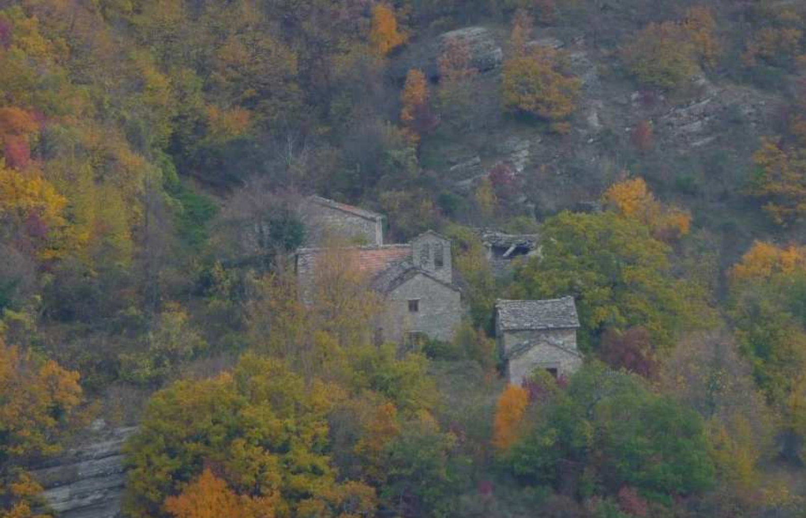
Brento Sanico Interno della chiesa